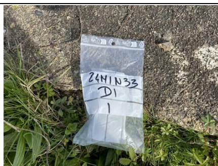
Photo n° PhA001 Localisation : Extérieur Ouvrage : Sol Description : Béton gris Localisation sur croquis : 1 Absence d'amiante